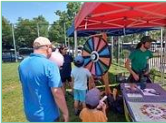
Fête de quartier - juillet 2022