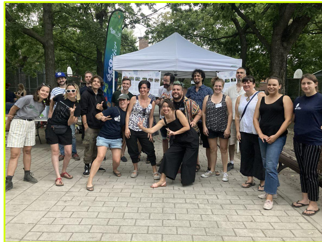
Partenaires et employé.e.s des éco-quartiers de Ville-Marie réunis pour les Journées des ruelles vertes autour de la thématique du verdissement et de la Transition Socioécologique - Septembre 2022

Table de développement social /CDC Centre-Sud, assemblées et rencontres du REQ, membre des CA de la CDC Centre-Sud et du REQ, consultations publiques de la Ville de Montréal et de l'arrondissement de Ville-Marie, planifications stratégiques de la Table de quartier et de la CDC Centre-Sud, démarches sur la transition socio-écologique, etc.