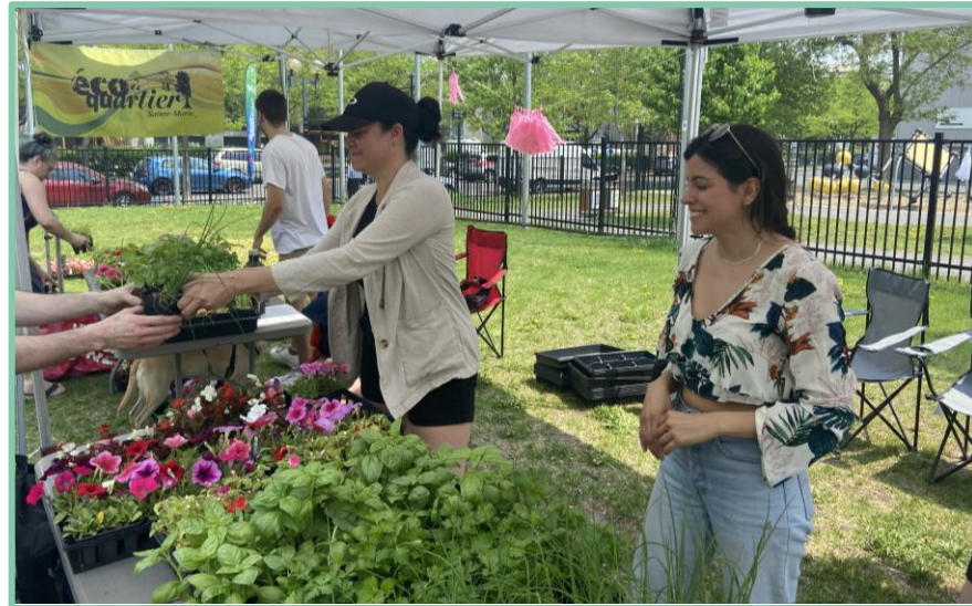
Campagne d'embellissement-Distribution des fleurs -mai 2022