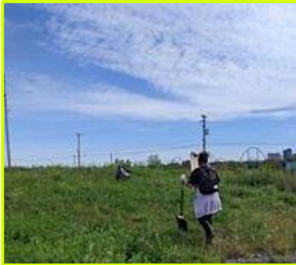
Journée du Fleuve - septembre 2022