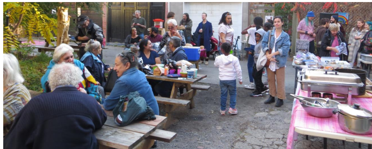
Fête des récoltes/Ruelle du bonheur- Octobre 2022