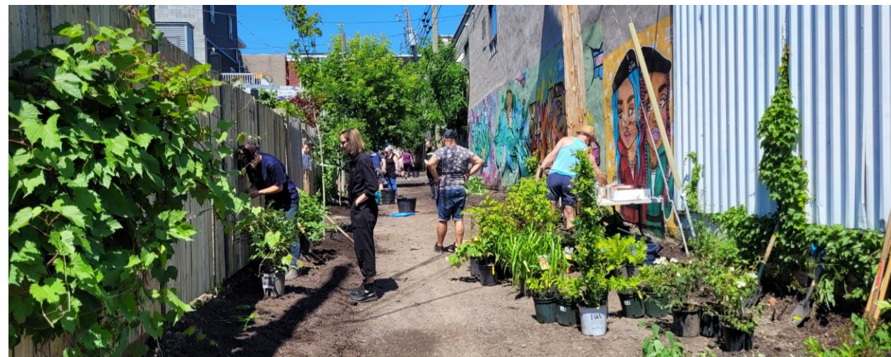
Activité de plantation ruelle Des Cheminots - juin 2022